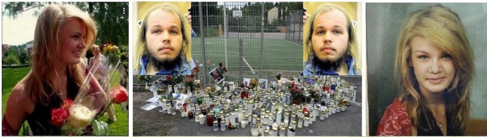
FINNISH GOVERNMENT AUTHORITIES WHO HAVE BEEN IN CONTACT WITH THE MURDERER BY DENYING HIM THE OPPORTUNITY TO LIVE A NORMAL LIFE IN FINLAND